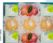
〈宗家 源 吉兆庵〉 夏菓撰 (1箱/9個入) 3,240円