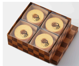
〈クラブハリエ〉 バームクーヘンmini 8個入 (1箱/8個入) 4,191円