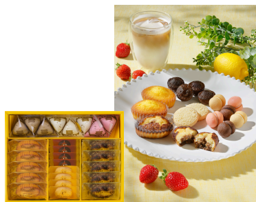
〈シーキューブ〉 ティラミス・ファンタジスタ26個入 (1箱/26個入) 3,240円

※6月下旬～7月上旬は配送事情により 配送日指定を承りかねる期間がございます。 予めご了承ください。