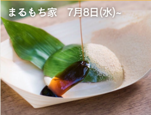
まるもち家 7月8日(水)~