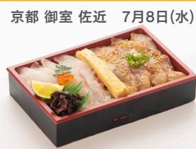
京都 御室 佐近 7月8日(水)~