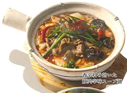
香辛料の効いた 豚肉辛味スープ麺

スイジャーロウメン 肉辛味煮込み麺 Stewed pork chili oil soup noodles 水煮猪肉面 1480円 (税込1628)