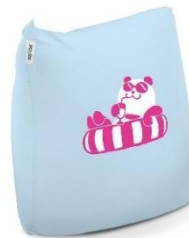
ナツパンダオリジナル Yogibo Mini