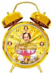
マツケンオリジナルボイス 目覚まし時計

全13コースから1つ選択し、抽選に応募できます（景品の数にはそれぞれ限りがあります）