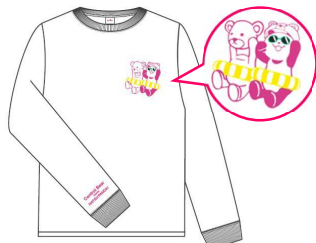
グラニフコラボ ロングTシャツ