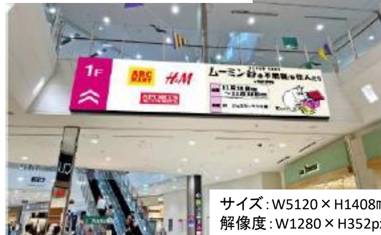
サイズ: W5120 × H1408mm 解像度: W1280 × H352px