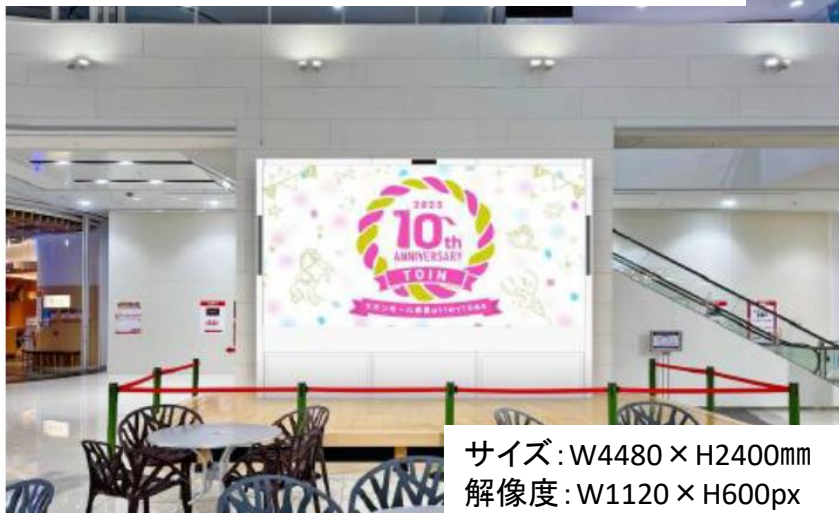
サイズ: W4480 × H2400mm 解像度: W1120 × H600px